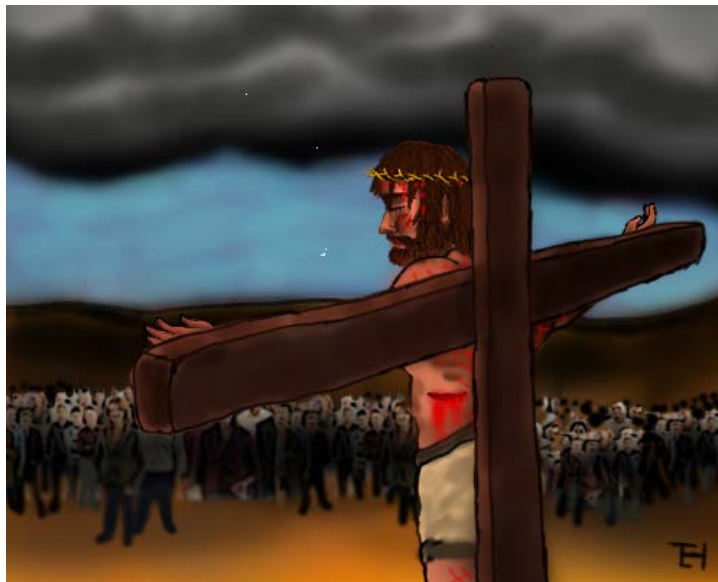
Christ died for sinners!

Roma 6:23 Alu'ujasa chi wayuu ayatakai süchepchiain kaainjalaa, shiimüin ouktajachin nia saaliijee sümaa amülouleechin nia nuulia Maleiwa. Otta chi eekai sa'aniraain nukuaippa nümaa Cristo Jesús chi Wasenyotsekai, ee'iranajaweerü naa'in süpüla chainjachin nia nümaa Maleiwa waneepia.