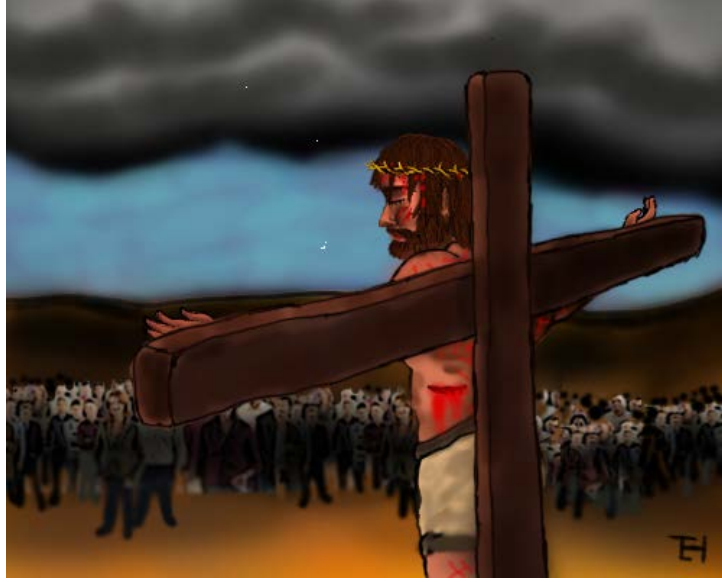
Christ died for sinners!

1 John 4:2-3 अक्खेल?रिक् खेइहा? निइवा?फुमाइलाम् कैदा:बासिबि मै:म्बि फा?आइ निइवा? खो:मा कैसुक्तुम्लो-हा:त्लै येसु ख्रिस्तेन् मैन्छाम्गेन् याप्मि पो:क्खेआइ नासिइगेन् थक्को त्थे ल?रिक् तैन्दिइ चोगु?, खेन् निइवा?फुमाइलाम् कैदा:बारो॥ कर हा:त्लै येसु ख्रिस्तेन् नासिइगेन् थक्को त्थे ल?रिक् तैन्दिइ मैजोगुन्, खेन् निइवा?फुमाइलाम् मै:न्, कर ख्रिस्तरै कुबिफ्युड्बाल्लै कुसाम्लाम्बा त्थेबारो॥ खेइग ता: कैल?बान् कैघेप्सुम्माइ कैवयि?, हैक्क्याइ इक्सादिइ खाम्बे:क्मो तगिसा खेइग त्थे चुरेआइ वा?रो॥